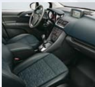
Astor, Tamno galvanizovana/Siena, Jet crna