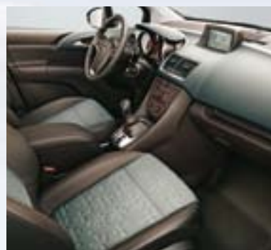
Astor, Svetlo galvanizovana/Siena, Kakao