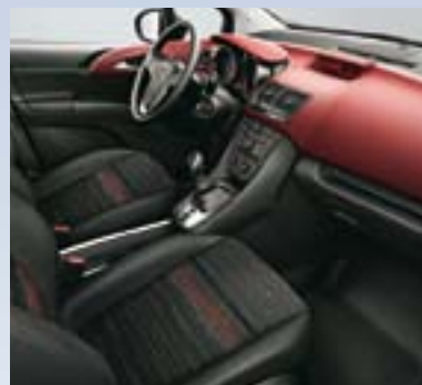
Horizont, Kari crvena/Atlantida, Jet crna