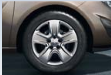
2 Dizajnirani točak, 6,5 J x 16, petokraki dizajn, pneumatici 205/55 R 16