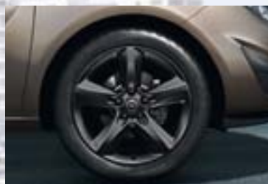
7 Točak od lake legure, 7 J x 17, petokraki dizajn, crn, pneumatici 225/45 R 17