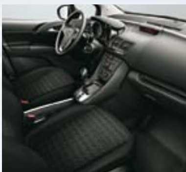
Salta, Jet crna/Atlantis, Jet crna