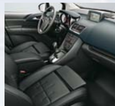
Koža Mondial 1 , Jet crna