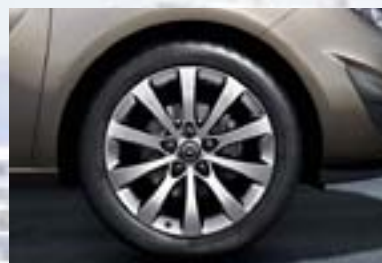
8 Točak od lake legure, 7 J x 17, dizajn sa 10 kraka, pneumatici 225/40 R 17