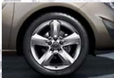
6 Točak od lake legure, 7 J x 17, petokraki dizajn, pneumatici 225/45 R 17