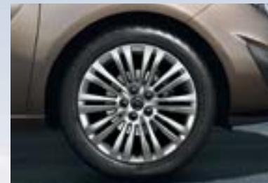
4 Točak od lake legure, 6,5 J x 16 i 7 J x 17, dizajn sa 10 duplih kraka, srebrn, pneumatici 205/55 R 16 ili 225/45 R 17