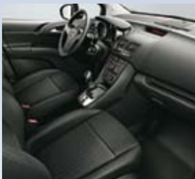
Biber, Jet crna/Atlantida, Jet crna