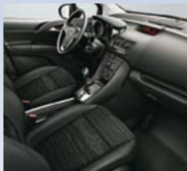
Horizont, Jet crna/Atlantida, Jet crna