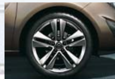
9 Točak od lake legure, 7,5 J x 18, petokraki dizajn, pneumatici 225/40 R 18. Legura sa prvoklasnim višeslojnim premazom.