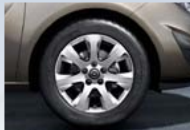
3 Točak od lake legure, 6,5 J x 16, sedmokraki dizajn, pneumatici 205/55 R 16