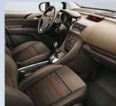
Horizont, Kakao/Atlantida, Kakao