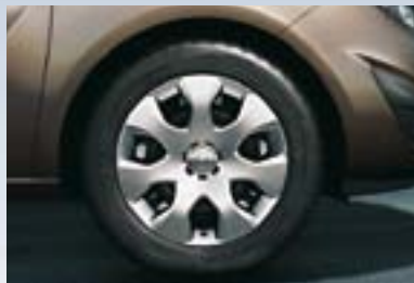
1 Čelični točak sa naplaticima, 6,5 J x 15 i 6,5 J x 16, sedmokraki dizajn, pneumatici 195/65 R 15 ili 205/55 R 16